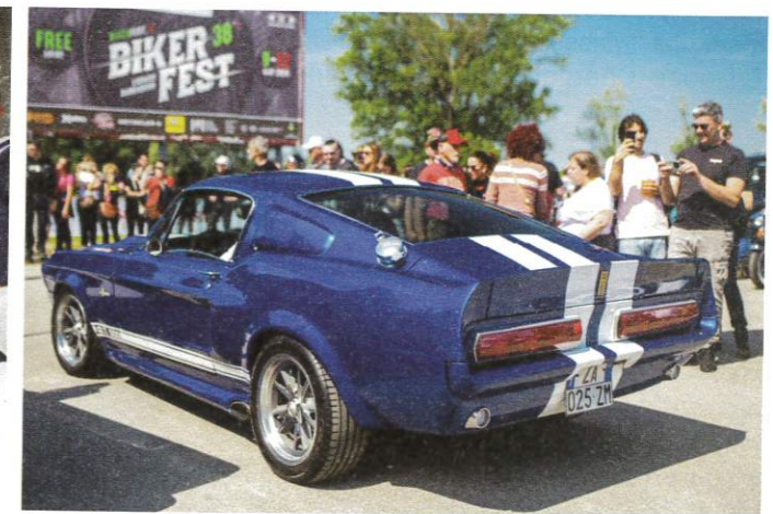
Auto d'Epoca Luglio-Agosto 2024