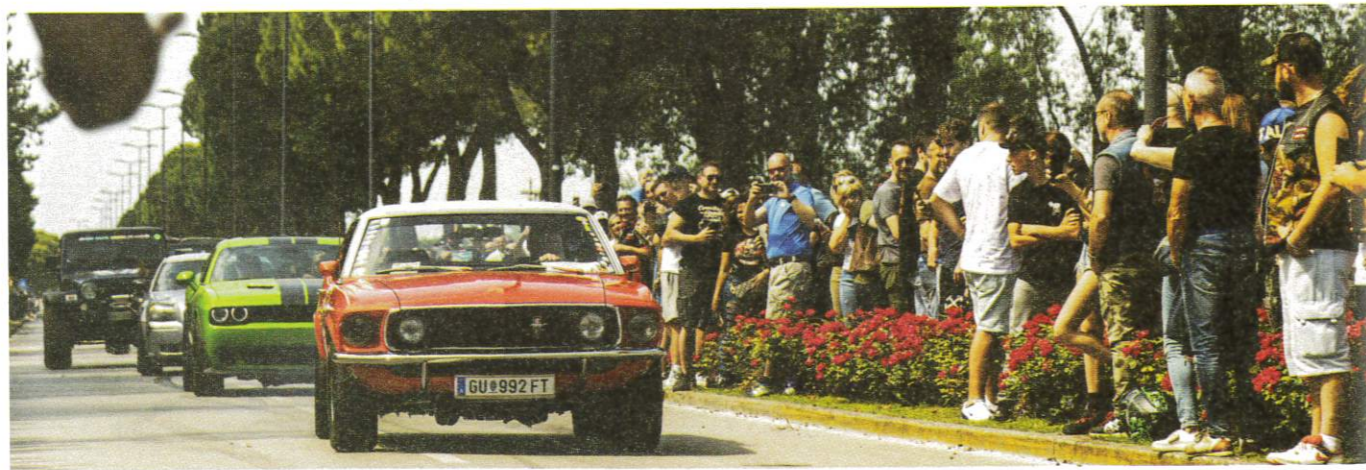
Auto d'Epoca Luglio-Agosto 2024

st International (11-12 maggio), festival motociclistico che dal 1995 ospita anche l'evento motoristico più "american" del Bel Paese. All'appello del magazine specializzato Cruisin' Life e del club pordenonese Old School Garage, co-organizzatori dell'incontro, hanno risposto non solo centinaia di proprietari e appassionati, ma anche migliaia di visitatori giunti da tutta Italia e dall'estero per godersi l'incredibile spettacolo di una Lignano gremita di rombanti V8. Massiccia, in particolare, l'affluenza dalla vicina Austria, soprattutto grazie alla partecipazione degli American Friends of Carinthia, del 1. Österr. US Car Club e del Mustang Cub of Austria. Quest'ultimo, punto di riferimento per i fan transalpini della pony car di casa Ford, ha festeggiato assieme agli italiani Mustang Register of Italy, Mustang Club Italia e Mustang & Muscle Cars Europe il compleanno della leggendaria coupé dell'Ovale Blu, che - presentata nel 1964 - spegne proprio nel 2024 le sue prime 60 candeline.